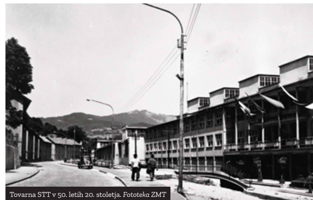
Tovarna STT v 50. letih 20. stoletja. Fototeka ZMT

Tovarno so večkrat širili, preimenovali in reorganizirali, po osamosvojitvi pa je kriza zaradi izgube jugoslovanskega trga udarila tudi po njej. Tako je po stečaju in z več naslednicami podjetje sicer še naprej delovalo, a je z obratovanjem dokončno prenehalo leta 2016. Na prostoru, kjer so nekoč izdelovali rudniško mehanizacijo (kjer je stal trboveljski ponos), je danes nakupovalno središče.